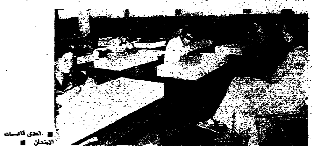
احدى قاعات الامتحان

جديدا في بعض التمديلات القديمة وبعض المذاكرة في شطب كلمة في سطر والثبات في سطر اخر، مع التثبيت باحكام اريد «بشم الهمة» للطلول المبتك كما يظهر في هذا الرسم بجملتي كثير التشاؤم للسنة الدراسية المقبلة.